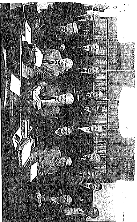
START UP I rappresentanti delle 14 aziende che hanno dato vita a 'Sviluppo Imprese Romagna'

Lunedì scorso c'è stato l'incontro tra i rappresentanti di 14 aziende (Avrion, Banca di Cesena, Banca Popolare dell'Emilia Romagna, Cassa di Risparmio di Cesena, Confarbiganato, Cna, Cesena Energia - Cnaeg, Confcommercio, Confcooperative, Fondazione Cassa di Risparmio di Cesena, Orogel, Studio Serafini, Techosym e Trevifin), che hanno sottoscritto il capitale sociale di un milione 125mila euro. E ci sono già aziende e istituzioni (Unindustria Romagna, Ivas, Hippogroup e altre ancora) che hanno annunciato l'intenzione di aderire